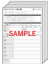
ロコミアンケート記入表 (ロコミ3~5件)