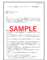
アピールポイントページ 制作依頼書