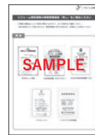
リフォーム瑕疵保険の 事業者登録を証する 書類の写し