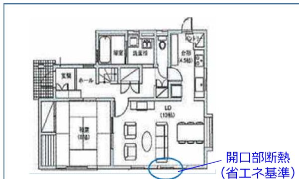
住宅の一部の断熱改修イメージ図（①ーイの基準に適合）

太陽光発電設備、太陽熱利用設備、高断熱浴槽、高効率給湯機、またはコージェネレーション設備のいずれかの設備を設置する工事